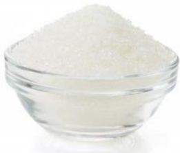
80 gr SUCRE