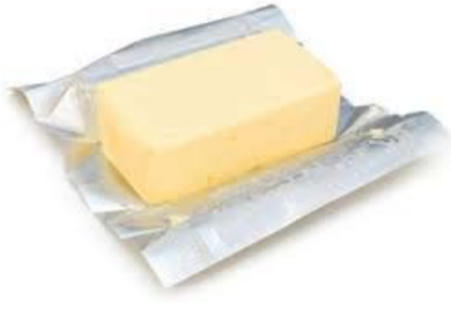
70 gr BEURRE FONDU