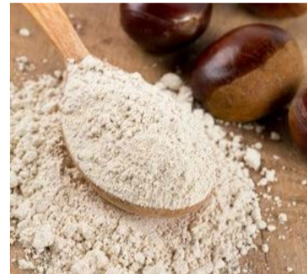
50 gr FARINE DE CHATAIGNE