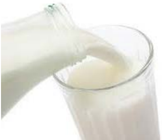
20 cl LAIT