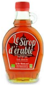
100 gr SIROP D'ERABLE